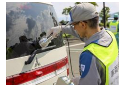
協定各社による避難地域時検査

①の事業者間協定の実効性をより一層高めるものとして、地理的近接性を活かし、「原子力災害時における協力」「廃止措置実施における協力」などを行っています。