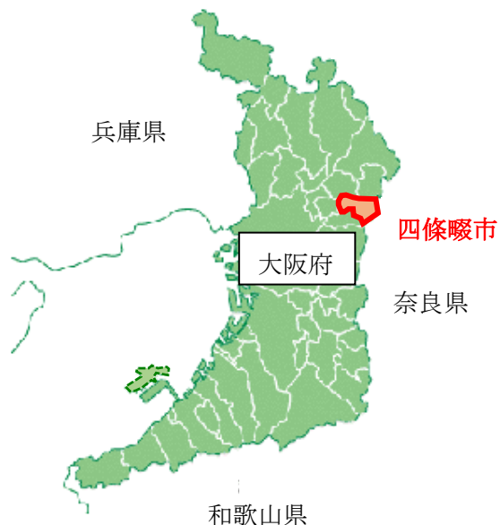
＜四條畷市の位置図＞