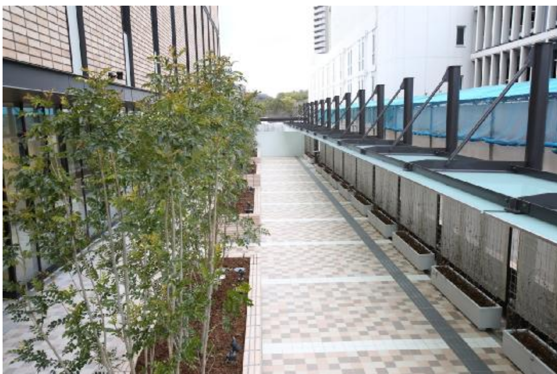
クールスポットも整備される北側デッキ（2017年2月撮影）

歩道橋と直結する北側デッキは、段差のないバリアフリー設計とし、点字ブロックも設置。人にやさしい回遊ルートを確認します。維持管理は豊中市と協力して行います。マンションが完成する2019年春には、新御堂筋を渡る千里橋まで伸び、新御堂筋西側のエリアと千里中央駅を行き交う歩行者のメインルートとなる予定です。