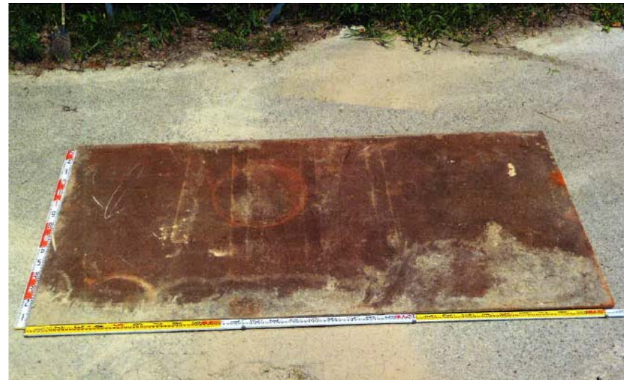
鉄板1枚 (約1.5m×約3.0m 厚さ22mm 約800kg/枚)