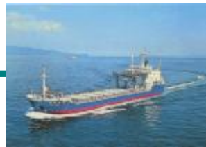
専用船「青栄丸」で青森県むつ小川原港まで海上輸送します。