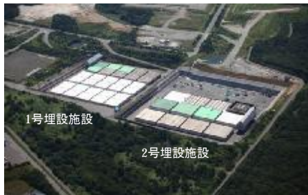
日本原燃 (株) 六ヶ所低レベル放射性廃棄物埋設センター