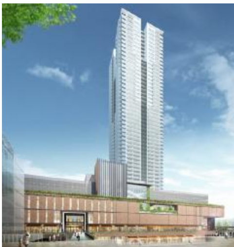
○計画建物（イメージ図）

よみうり文化センター（千里中央）再整備事業では、現施設を、スイミングスクール用のプールやクリニックモールを併設した商業施設と、千里のランドマークとなる高さ約185mのタワーマンションに建て替えます。商業施設とマンションからなる街区名を「SENRITO」、商業施設名は「SENRITO よみうり」としました。商業・住宅施設の一体整備に加え、施設沿い2階レベルに豊中市との基本協定に基づく歩行者回廊（デッキ）を新設し、北大阪急行電鉄及び大阪モノレールの「千里中央」駅や周辺施設との回遊性を高めます。