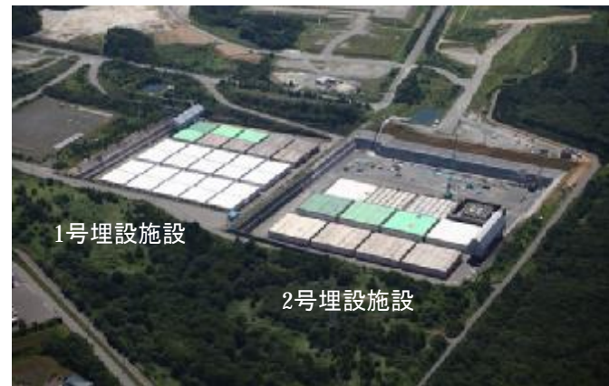
日本原燃 (株) 六ヶ所低レベル放射性廃棄物埋設センター