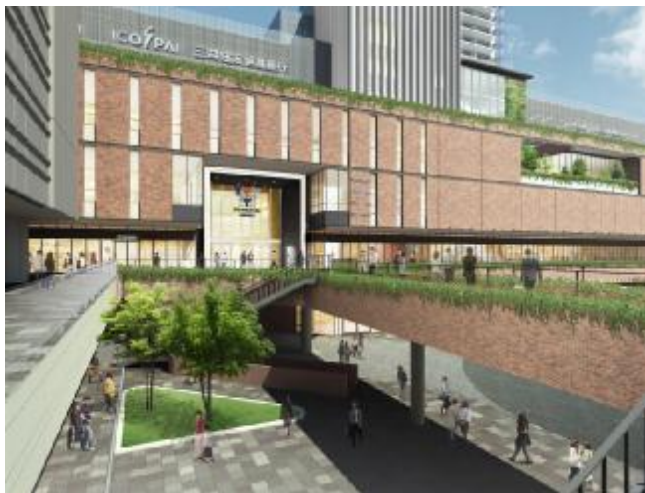
○ I 期側の歩行者回廊（デッキ）イメージ図

よみうり文化センター（千里中央）再整備事業では、現施設を、スイミングスクール用のプールやクリニックモールを併設した商業施設と、千里のランドマークとなる高さ約185mのタワーマンションに建て替えます。商業施設とマンションからなる街区名を「 SENRITO 」、商業施設名は「 SENRITO よみうり 」としました。商業・住宅施設の一体整備に加え、施設沿い2階レベルに豊中市との基本協定に基づく歩行者回廊（デッキ）を新設し、北大阪急行電鉄及び大阪モノレールの「千里中央」駅や周辺施設との回遊性を高めます。