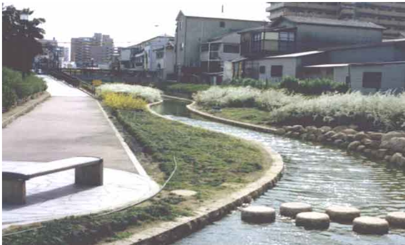
内川緑地せせらぎ水路