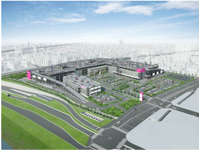
(仮称) イオンモール堺鉄砲町イメージ図