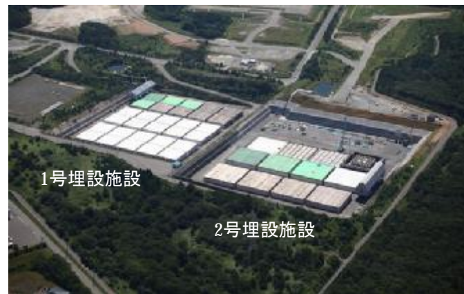
日本原燃 (株) 六ヶ所低レベル放射性廃棄物埋設センター