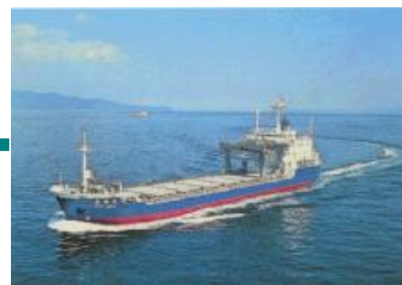
専用船「青栄丸」で青森県むつ小川原港まで海上輸送します。