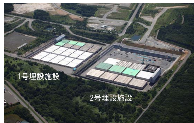
日本原燃 (株) 六ヶ所低レベル放射性廃棄物埋設センター