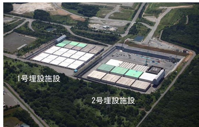
日本原燃（株）六ヶ所低レベル放射性廃棄物埋設センター