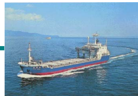
専用船「青栄丸」で青森県むつ小川原港まで海上輸送します。