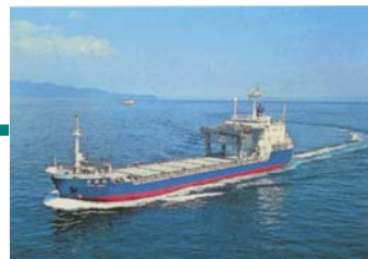
専用船「青栄丸」で青森県むつ小川原港まで海上輸送します。