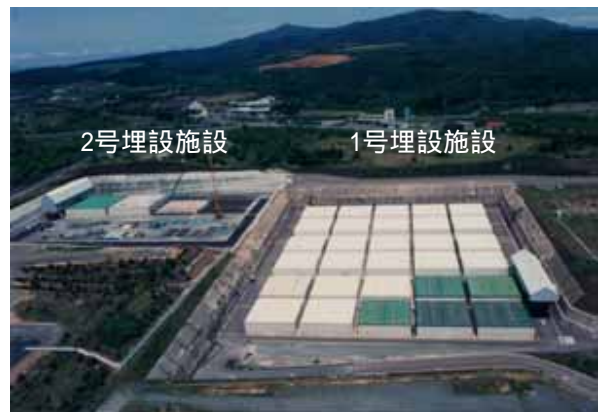
日本原燃（株）六ヶ所低レベル放射性廃棄物埋設センター