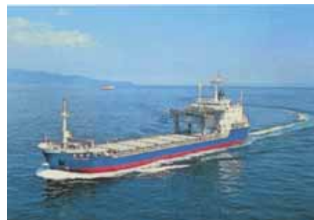
専用船「青栄丸」で青森県むつ小川原港まで海上輸送します。