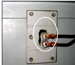
損傷部 (風量検出器取出部) 約30mm × 約60mm